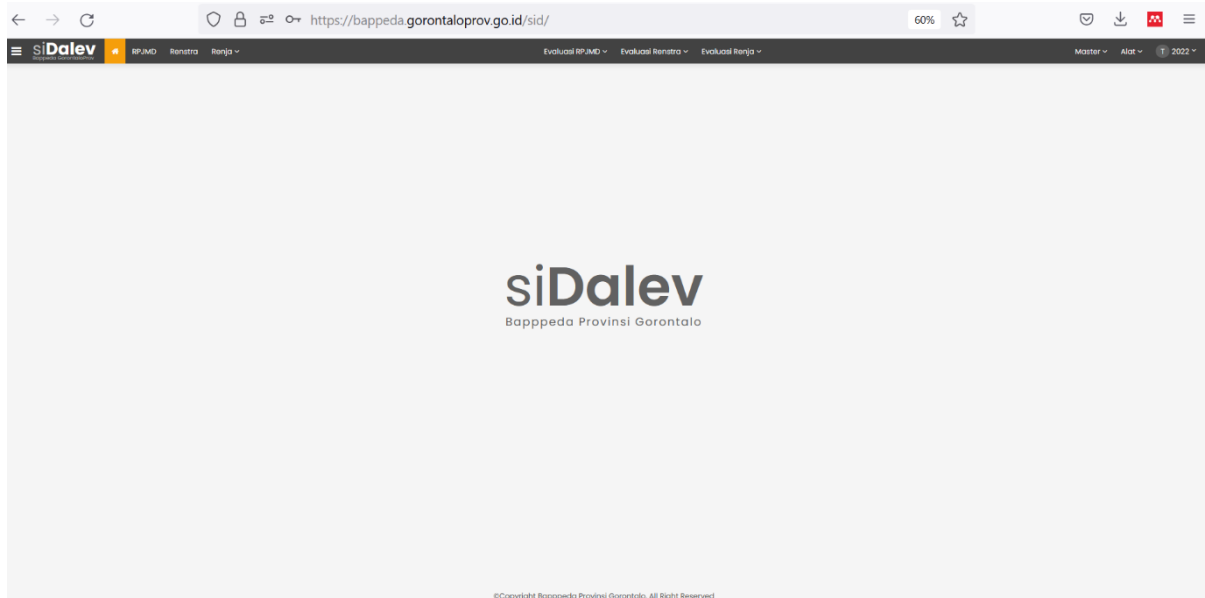
Tampilan Halaman Utama